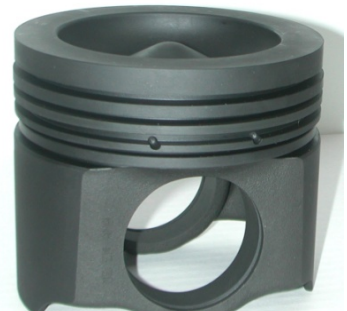
Pistón de una pieza