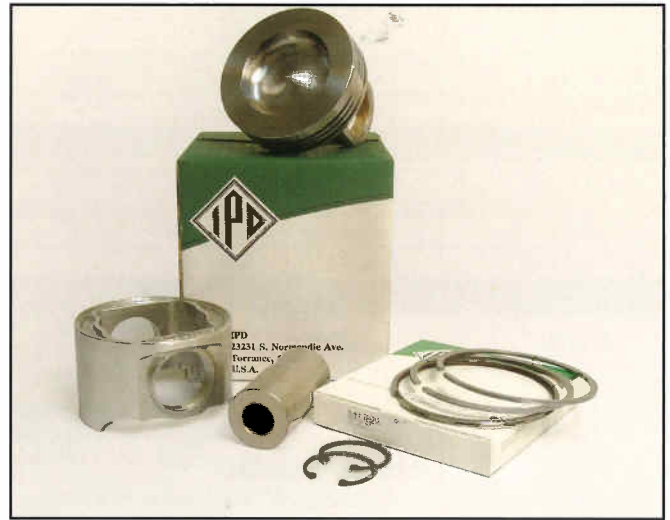
通用IPD活塞组件（PK组件）

IPD 23231 S. Normandie Ave. Torrance, CA 90501 310-530-1900 (电话) 310-530-2708 (传真) www.ipdparts.com