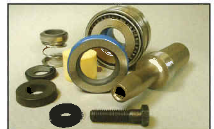
常用水泵成套修复组件。