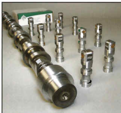
常用凸轮轴和凸轮从动件。