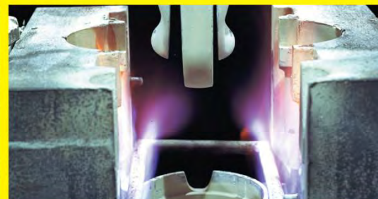
Fabricación a nivel mundial

IPD cuenta con la certificación 9001:2008 emitida por Lloyd's Register