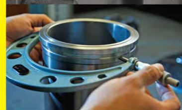
Ingeniería y diseño

IPD IS A GLOBAL MANUFACTURING AND DISTRIBUTION COMPANY PROVIDING QUALITY COMPONENTS FOR HEAVY-DUTY EQUIPMENT