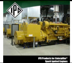
IPD Products for Caterpillar® Spark Ignited Engines

Haga clic aquí para obtener más información